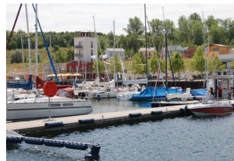
La Marina et son port à Mùcheln