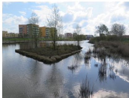
Le canal paysager à Bois d'Arcy