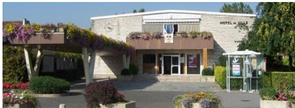
Les Hôtels de Ville