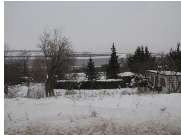
Décembre 2010 : le lac à Mûcheln en fin d'aménagement