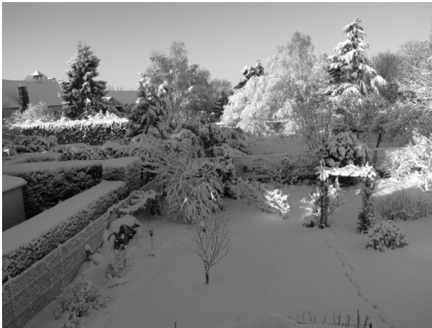
Janvier 2011 : Ferme Sainte Marie avant aménagement : vue champêtre de Bois d'Arcy