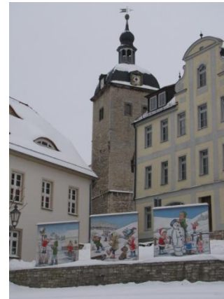
Mùcheln en décembre 2010